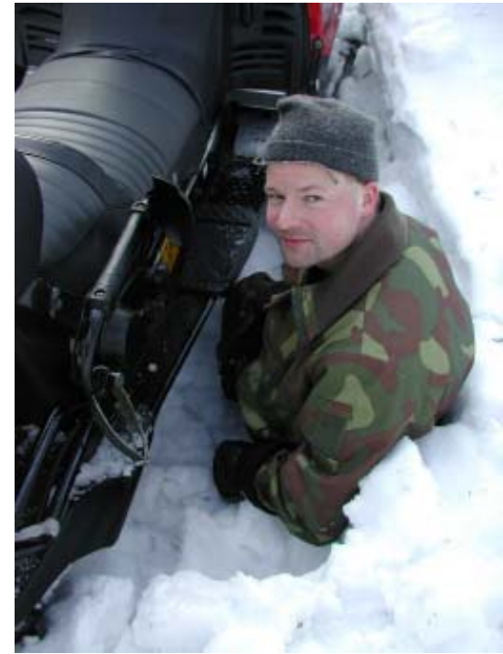
Lue Suomen Sotilas -lehden seuraavasta numerosta miten Tarun iskuryhmä selvisi Ilomantsin kelkkatestistä viime maaliskuussa.

Muuten ole yhteydessä kerhojen asianomaisiin vastuuhenkilöihin esim. VaPePa- ja ammunta-asioissa. Espoon-Kauniaisten paikallisosaston yhteystiedot ja kurssitarjonta parhaiten: http://gamma.nic.fi/~eskapat/