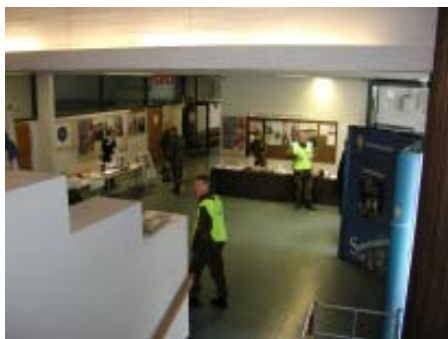
Aamun viimevalmistelut käynnissä

Paljon järjestelyjä tehtiin iltapuhteina ja loppua kohti yhä kovemmassa paineessa, mutta tulokset ja palautteet ovat olleet lupaavia. Tästä on meidän sekä muiden kerhojen hyvä jatkaa.