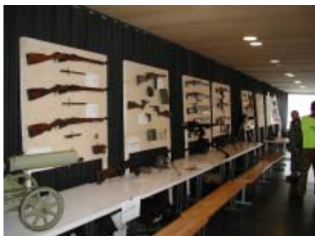
Asenäyttely Taistelulukion yläaulassa