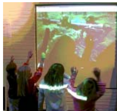
Kuvat toiminnasta kiinnostivat myös perheen nuorimpia.

Tarjolla oli kerholehden sekä piirilehden uusinta numeroa sekä edellisiä numeroita. Uudet jäsenet saivat lisäksi Suomen Sotilas lehden näytenuumeron.