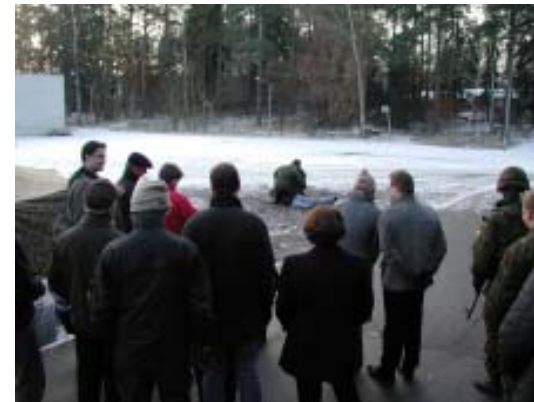
Yleisö seuraa voimankäyttönäytöstä.

Espoolaisille reserviläisille sekä heidän perheilleen tarjottiin tilaisuus tutustua oman kaupunkinsa maanpuolustustoimintaan, Tapiolan keskustan liepeillä. Ovet olivat avoinna kello 11-15 ja esittelijämme paikanpäällä auliina esittelemään toimintaa. Paikka oli “taistelulukio” eli Tapiolan lukio, joka homevaurioisena toimii urheiluseurojen sekä reserviläisjärjestöjen toimintakeskuksena - toistaiseksi. Vastaavalle on tarvetta ollutkin.