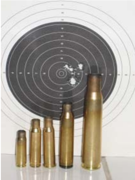
7.62x39, .308, 7.62x53R, .338 LM ja .50 BMG

huusin ja suupieleni venyivät vähintäänkin korviin. Katsoin kiikarin läpi osumaa ja siellähän se, kymmissä. Taululle päästyäni huomasin että napakymppi oli jäänyt 1 cm:n päähän. Kyllä takoo tämäkin tarkasti, vaikkakaan kyseinen ase ei pääse oikeuksiinsa tällä matkalla. Olin varmaan nirvanassa seuraavat 15 minuuttia.