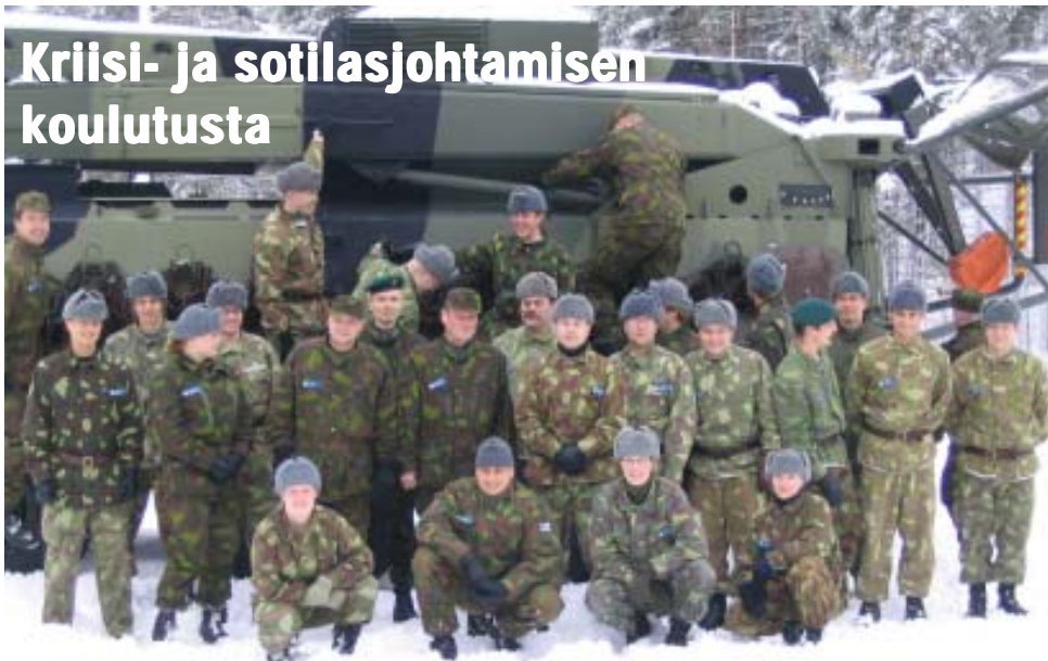
Kriso Int kurssi 15 kurssikuvassa

KRISO-kurssien syntysanat lausuttiin 90-luvun alkupuolella Reserviupseeriliiton koulutustoimikunnassa. Silloin elettiin NL:n hajoamisen jälkimainingeissa ja Pariisin rauhansopimuksestakin oli päästy eroon. Siihen mennessä RUL ja koulutustoimikunta olivat pyörittäneet Johtamistaidon kurseja jo yli 20 vuotta. Nämä kaikille avoimet RU-piirien järjestämät kurssit alkoivat vähitellen jäädä laadukkaan kaupallisen tarjonnan jalkoihin, ja jotain piti tehdä.