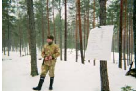
RUK kouluttajakurssi nro 5

keväällä ja ne ovat kertausharjoituksia. Kurssin käyneiltä odotetaan myös sitoutumista kouluttajatehtäviin Maanpuolustuskoulutus ry:n kursseille tai puolustusvoimien harjoituksiin.