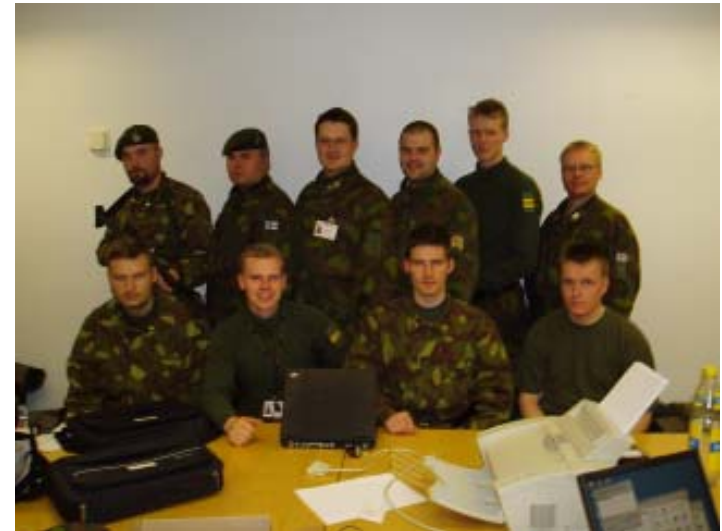
Paikallisvartiokompanialla on tärkeitä tehtäviä perustamisessa ja kohteiden suojaamisessa. Tämä runkohenkilöstö on tehtäviensä tasalla. Yhdistystemme jäsenet toimivat sotilasalueen kaikissa organisaatioissa erittäin vastuullisissa tehtävissä.