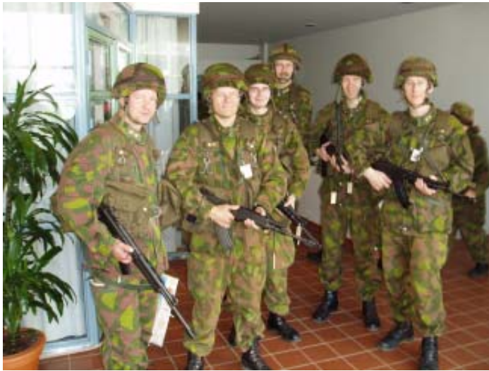
Esikunnan eri toimistoista oli aina edustajat mukana päällikön kiertäessä sotilasalueen joukkoja. Tässä odotellaan päällikköä ja lähtöä tarkastamaan taisteluosasto Nuolta.