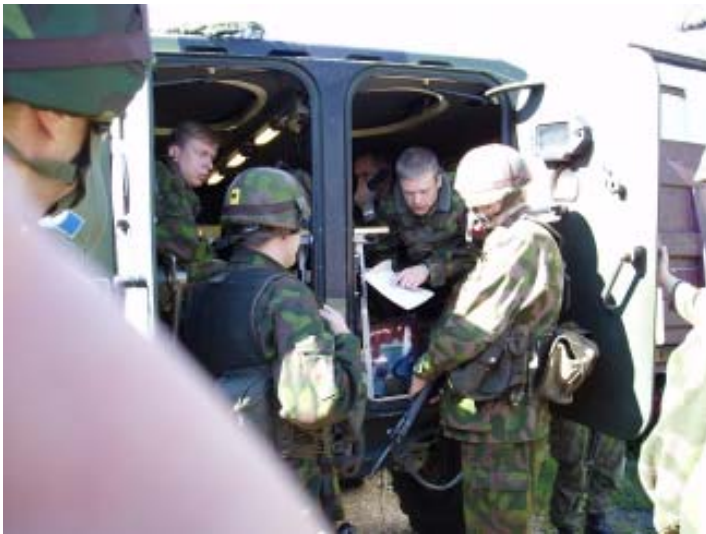
Taisteluosasto Nuoli Porista alue-etsinnässä Finnoon alueella. Sotilasalueen päällikkö komento-pasissa vasemmalla, tst-osaston komentaja puhelimessa vaunussa oikealla. Valmiusprikaatin kalusto oli kaikilta osin ensiluokkaista.