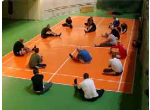
Lihashuoltoa - vapaa-ajantoimikunta näyttää mallia. Hyödyllistä ja mukavaa.