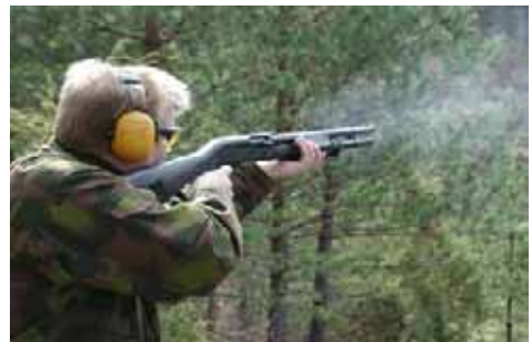
Aktiivista kesää toivottaen,